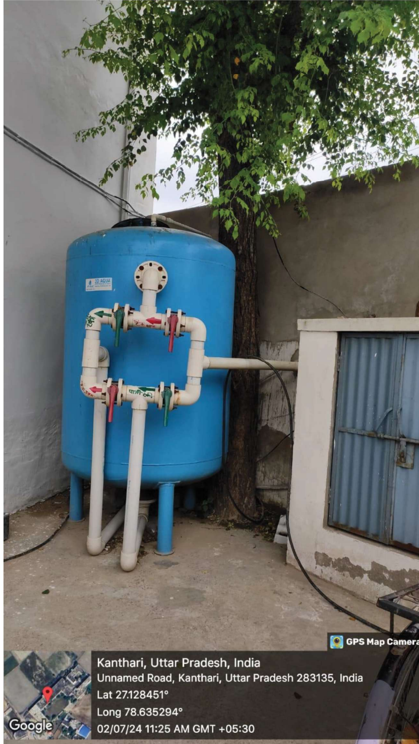
Filter for Water Tanks

Established by the U.P. Govt. Act No. 7 of 2015 Recognized by U.G.C. under section 2(f) of Act. 1956