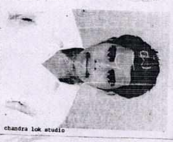
chandra lok studio

SHIKOHABAD ACCOUNT NO: 4044349326 GSTIN: 09AAAC0249R03ZZ